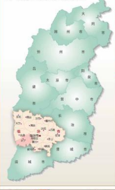
乡宁县在山西省的位置